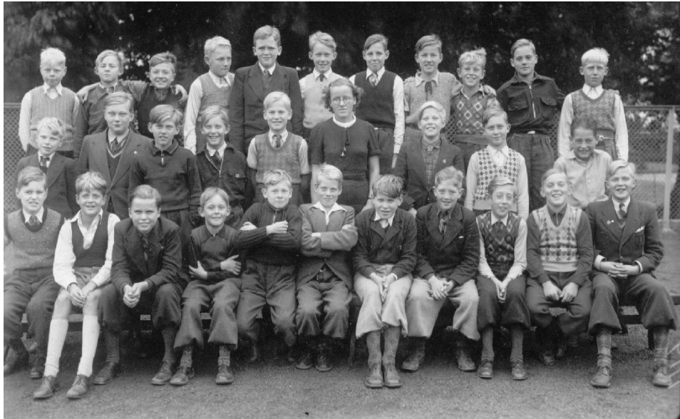
Klass 2:5a år 1941

Vi krävde av lärarna att de kände oss och våra kunskaper tillräckligt för att ge alla en riktig värdering. Snällhet var inte avgörande. Ök/smeknamn hade de allra flesta. "Nollan" hade sitt efter sin noggranna kunskapsbokföring av oss med allt från trippeltreor till trippelnollar, åtminstone hade vi uppfattat det så. "Tjatte" hade sitt efter ett ofta använt uttryck "tja, ju autostradametoden". "Tjigern" efter sitt uttal av tigerhopp i gymnastiken. "Tomten" efter sitt yviga skägg. "Kylaren" för Kuylenstierna var ren namnförädling. Det var väl snarare en brist om läraren saknade ett av eleverna uppfunnet tillmäle.