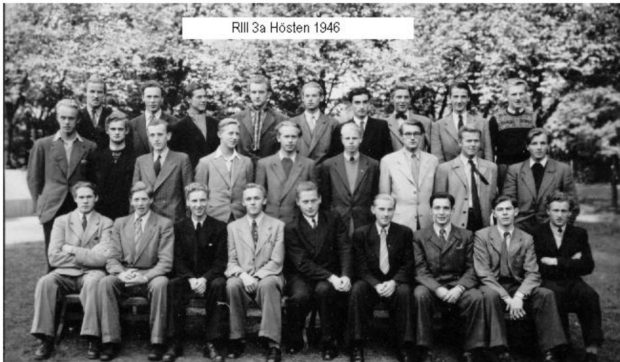
R111 3a Hösten 1946

Någon "riktig" realgymnasiestuderande blev jag ju inte eftersom jag vid valet av ämnen fr.o.m. ring 2 varken läste fysik, kemi eller specialmatematik utan som tillvalsämnen hade tyska, franska, filosofi och geografi. Fasta ämnen var kristendomskunskap, modersmålet, engelska, historia med samhällslära och matematik allmän kurs. Under gymnasietiden förstärktes kunskaperna med enskilt arbete (obligatoriskt sommarinhämtande av extra kunskaper i visst ämne), t.ex. i svenska språket och litteraturen (Frödings författarskap) och filosofi (Vittnespsykologi).