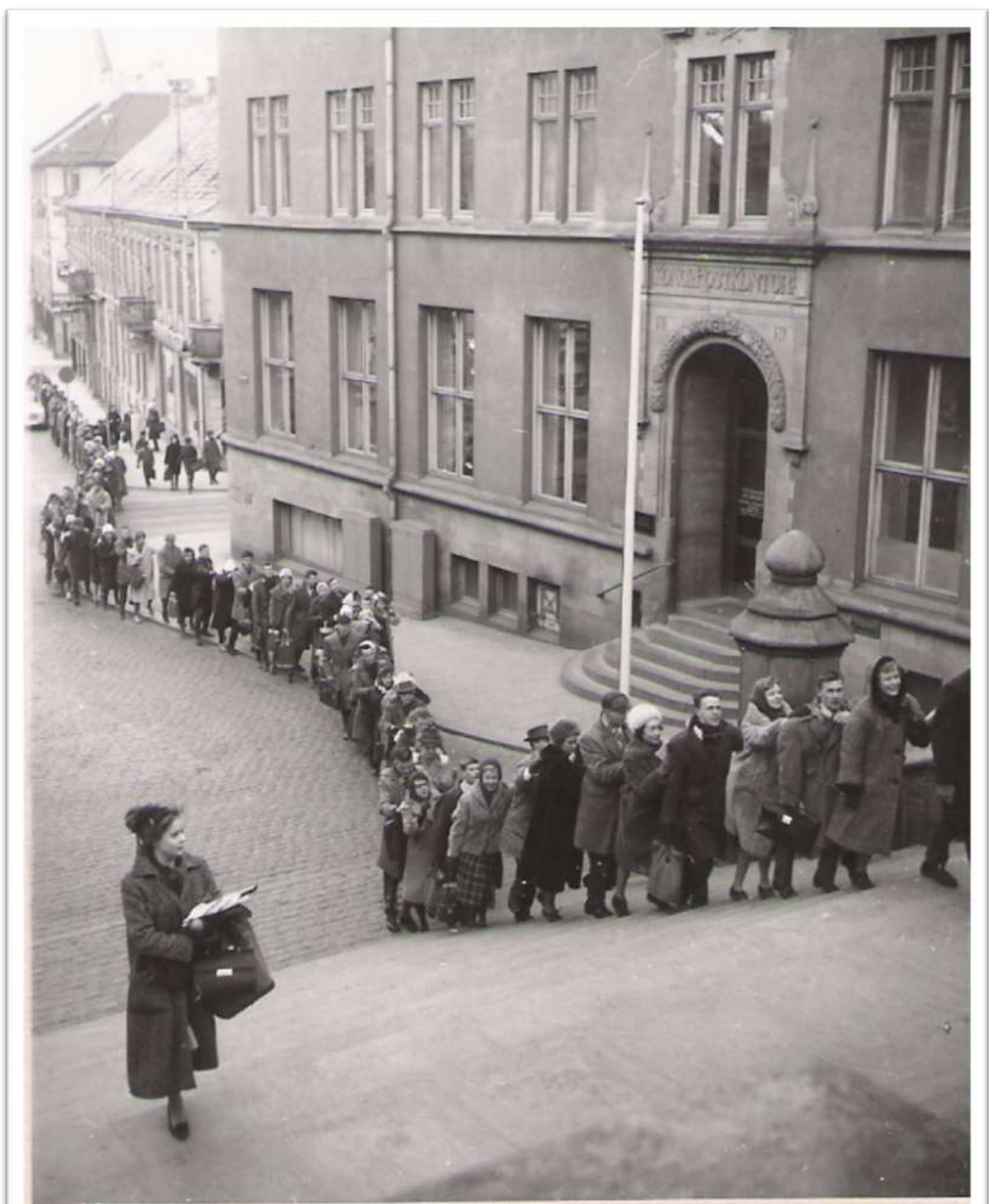
Gåsmarsch 200 personer