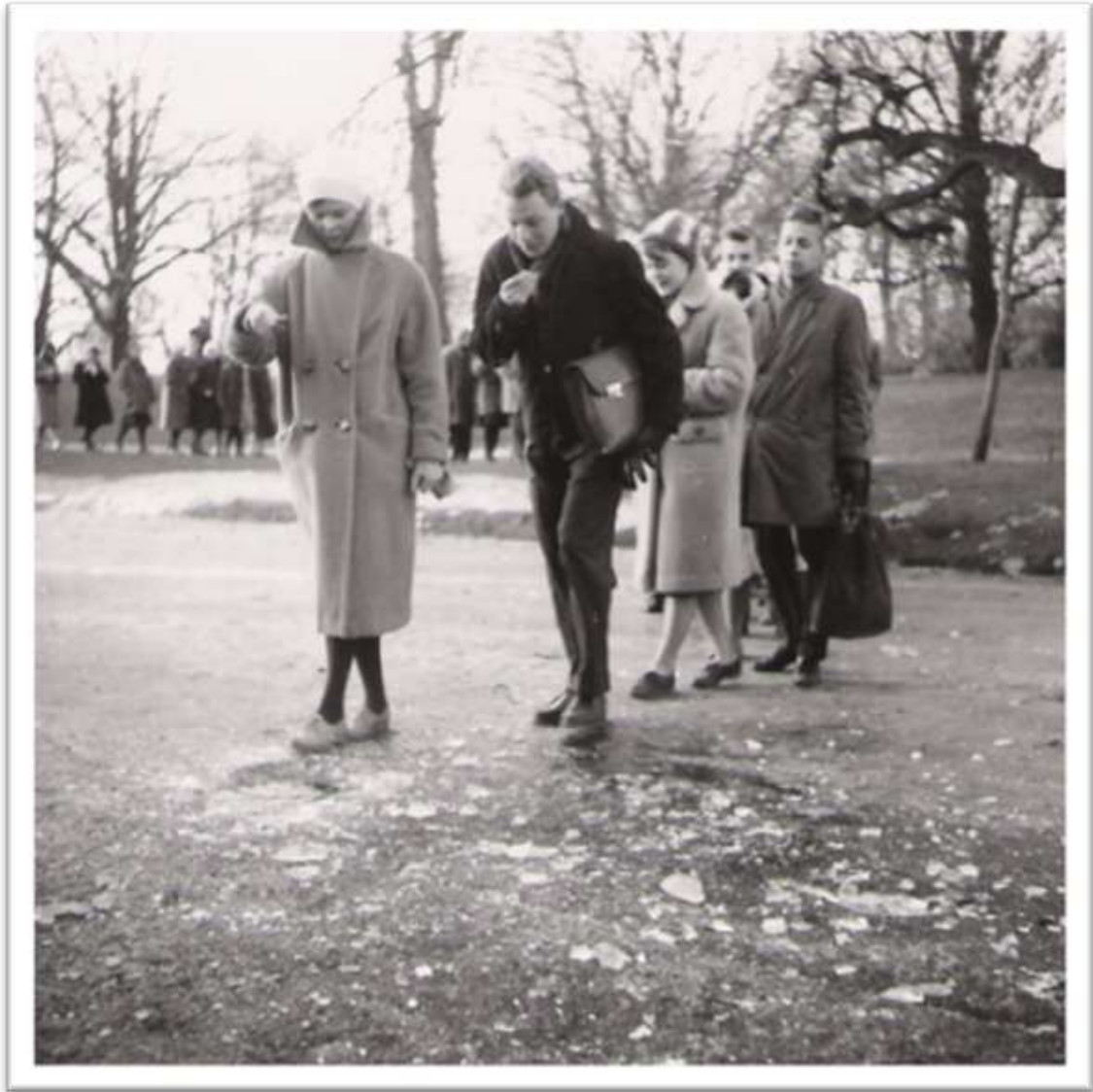
Krönikören själv, mitt i långa raden. Tvi, Tvi...