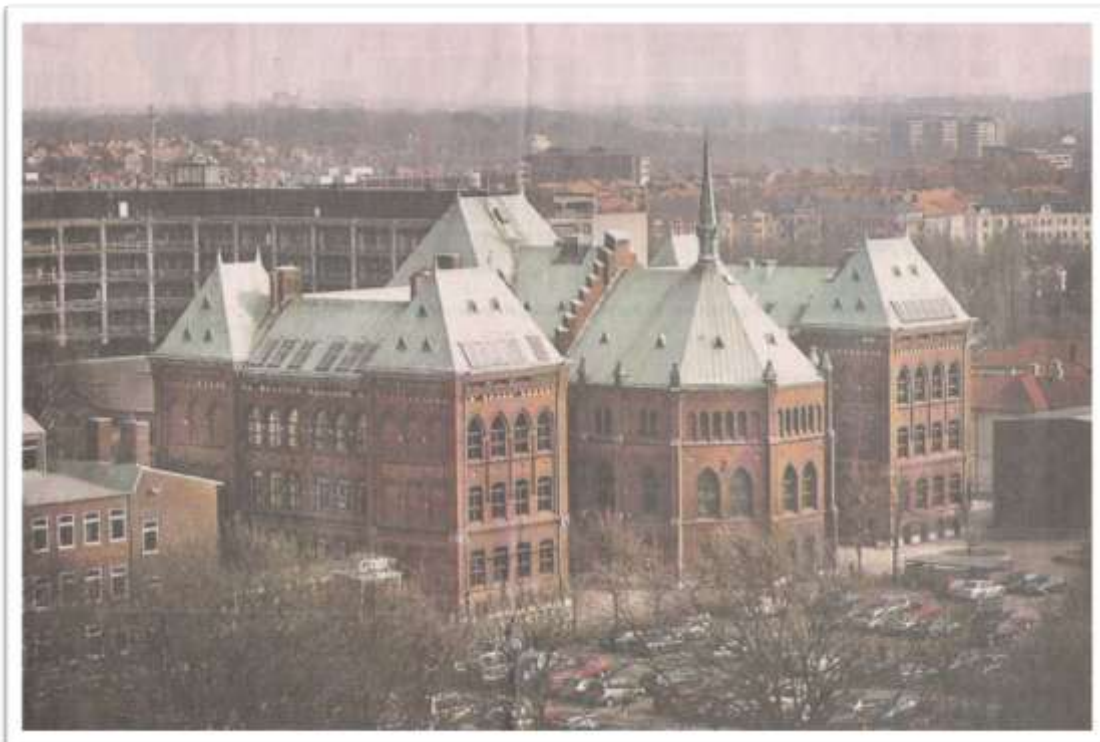
Gossis idag sett från en ovanlig och vacker vinkel