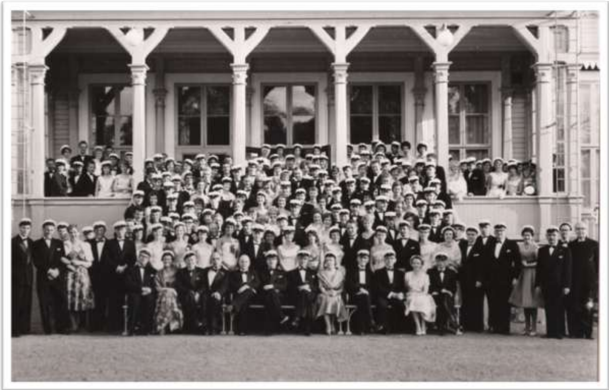
Här är vi drygt 230 personer