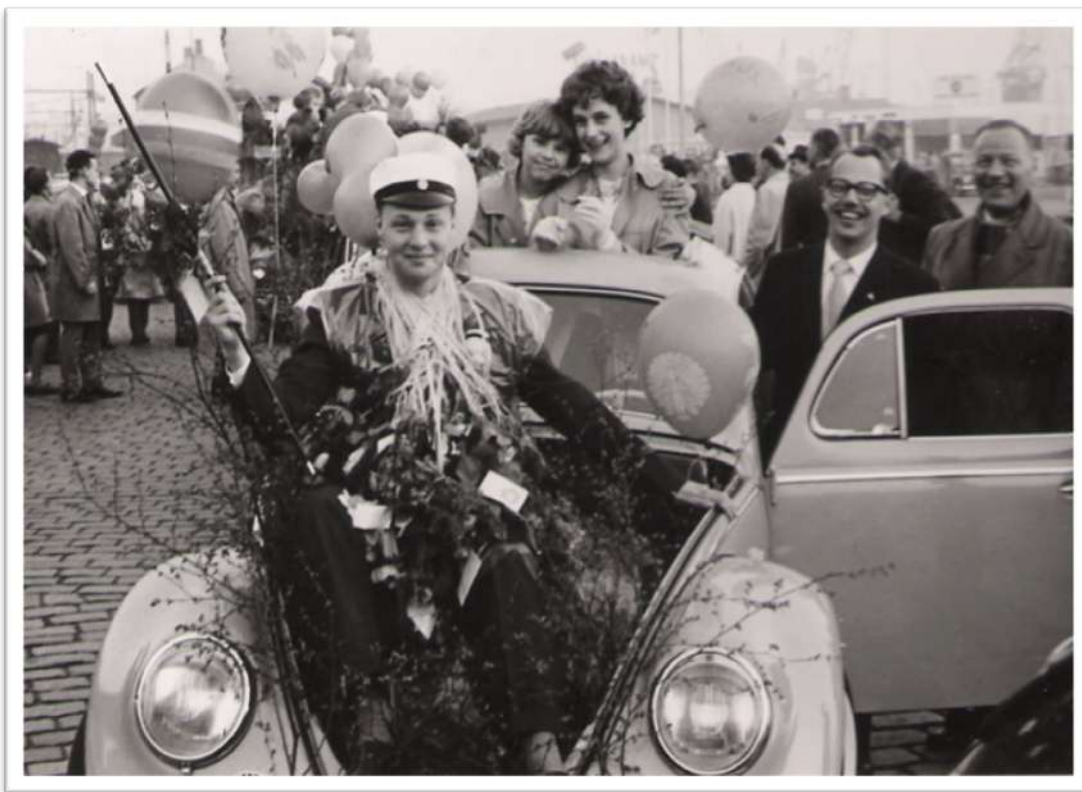
Exempel på ekipage: "En öppen tysk landå"