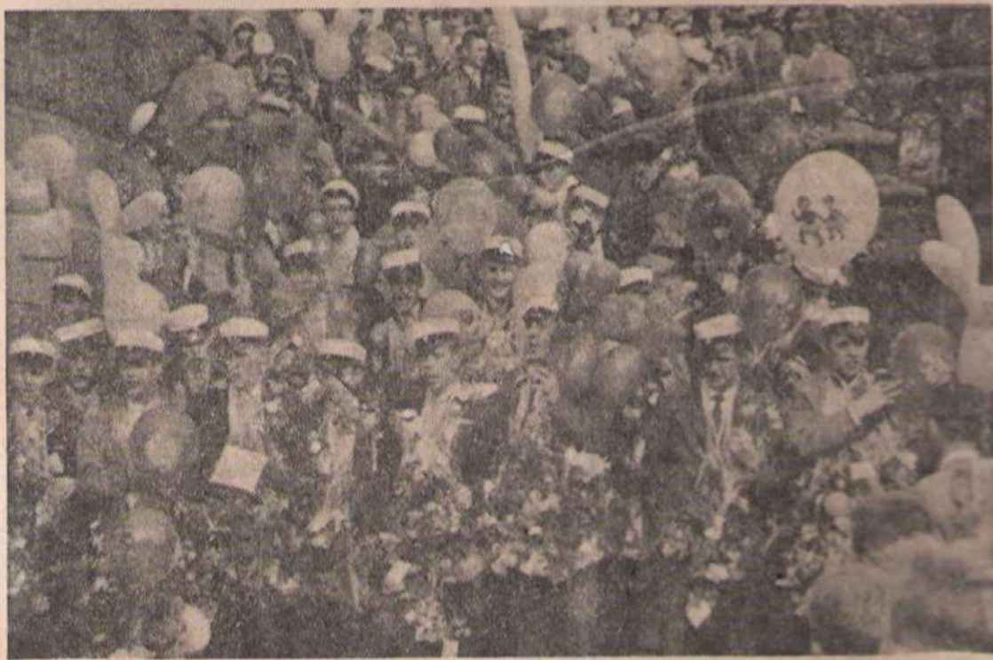
På terrassens trappa blev det åtskilliga uppställningar för fotograferna.

Nybakade studenter brukar använda festliga och originella sätt för transport av vänner och bekanta till de väntande festligheterna men frågan är om inte rekordet i den vägen slogs i går: spårvagn modell å!