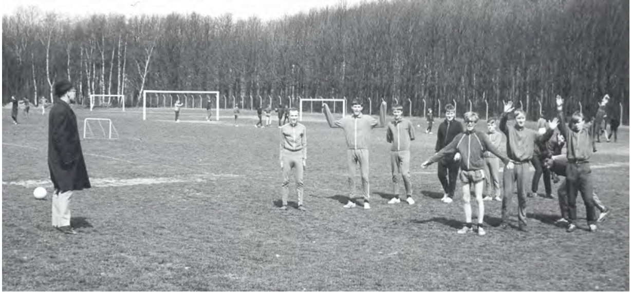
Gymnastiktimmarna kunde förläggas till Olympiafältet där även de mest ointresserade i fotboll platsade i ett lag. Okänd lärare till vänster håller uppsikt.