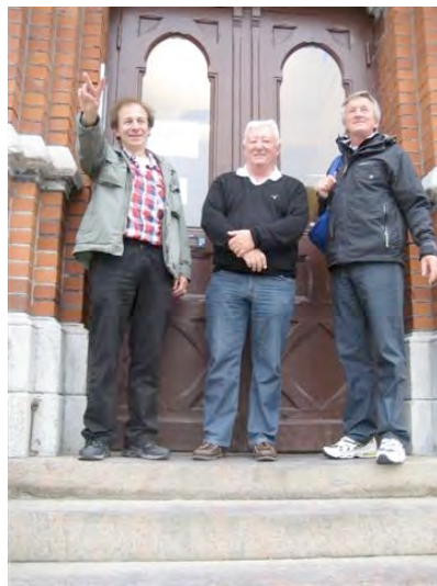
Vi försökte komma in på skolan men damen i porttelefonen var tuffare än Skorvas